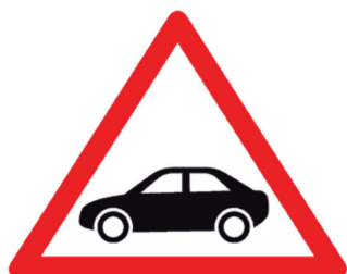
Conducción: ver prospecto

Busque en el cartonaje de los medicamentos que esté tomando si aparece el siguiente símbolo de advertencia: