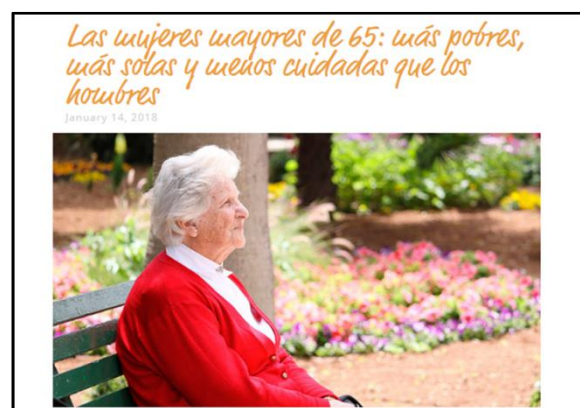
Imagen 5: