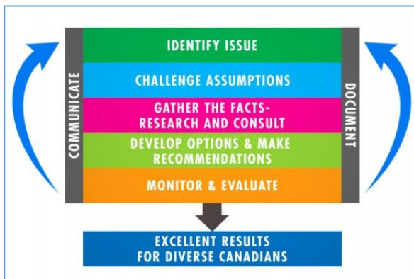
Figura .1 Gender-based Analysis Plus (GBA+) herramienta desarrollada por Status of Women Canada.

- Análisis sexo-género de los problemas de salud a los que nos enfrentemos, revisando la evidencia científica existente, así como los sesgos de género descritos en el tema. Existen herramientas para ello (SGBA de Canadá 16 (Figura 1) o Matriz para el análisis de género de la Gender Mainstreaming for Health Managers: A Practical Approach de OMS Adaptado por PAHO 29 (Figura 2)). La metodología consiste en considerar cada problema de salud en sus distintos aspectos: factores de riesgo y vulnerabilidad, accesibilidad a los recursos, consecuencias para la salud y resultados en salud existentes y, para cada uno de estos aspectos valorar cómo influye el sexo (categoría biológica) y cómo se ven afectados cada uno de ellos por los roles de género. Por ejemplo, sobre el tabaquismo como factor de riesgo, existen estudios donde existe mayor vulnerabilidad biológica (sexo) para el cáncer de pulmón debido al tabaco en mujeres y además actualmente existe una mayor vulnerabilidad para que las chicas jóvenes fumen, debido a la construcción de los roles sociales (género).