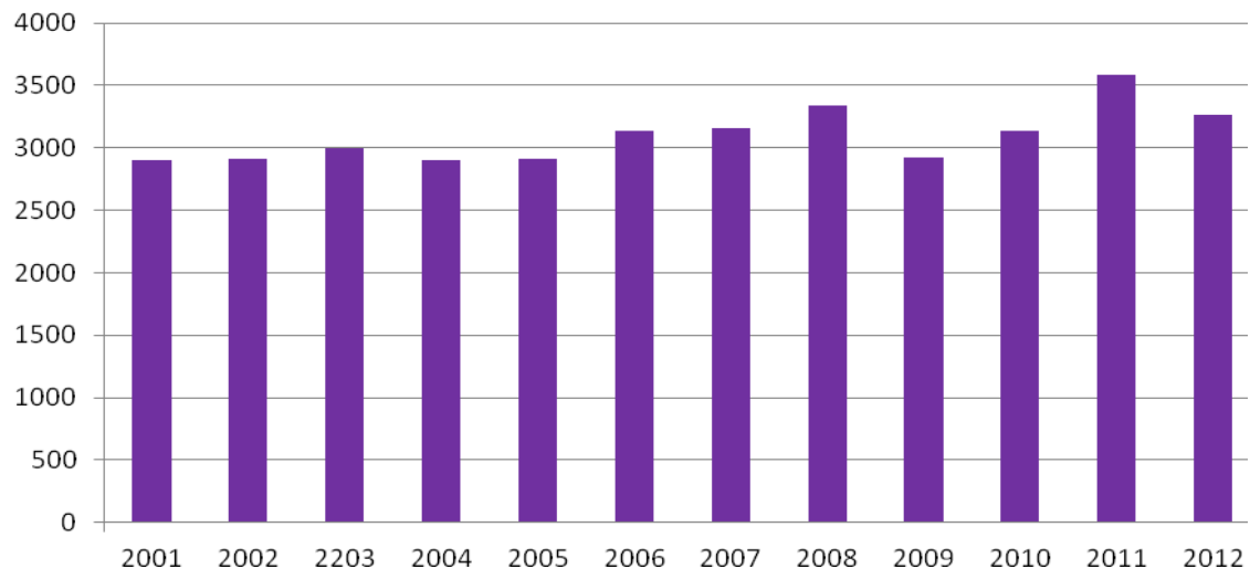
Tabla 25.- Evolución IVE en Castilla y León según provincia y año. 2001 a 2012