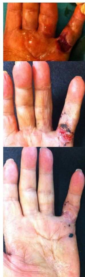
Figura 3 Dehiscencia de piel tras estiramiento dedo, a los 15 y a los 25 días (cura por segunda intención).

En 9 pacientes (25,7%) se produjo durante el estiramiento del dedo dehiscencia de la piel que se resolvió sin complicación con curas ( fig. 3 ); 13 pacientes (37%) presentaron hematoma y/o flictenas en la zona de la punción; no