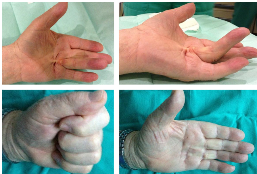
Figura 4 Enfermedad de Dupuytren 4.º dedo previo a la administración de CCH y al mes de la administración del CCH.

existieron complicaciones locales, vasculares, tendinosas, nerviosas o infecciones.