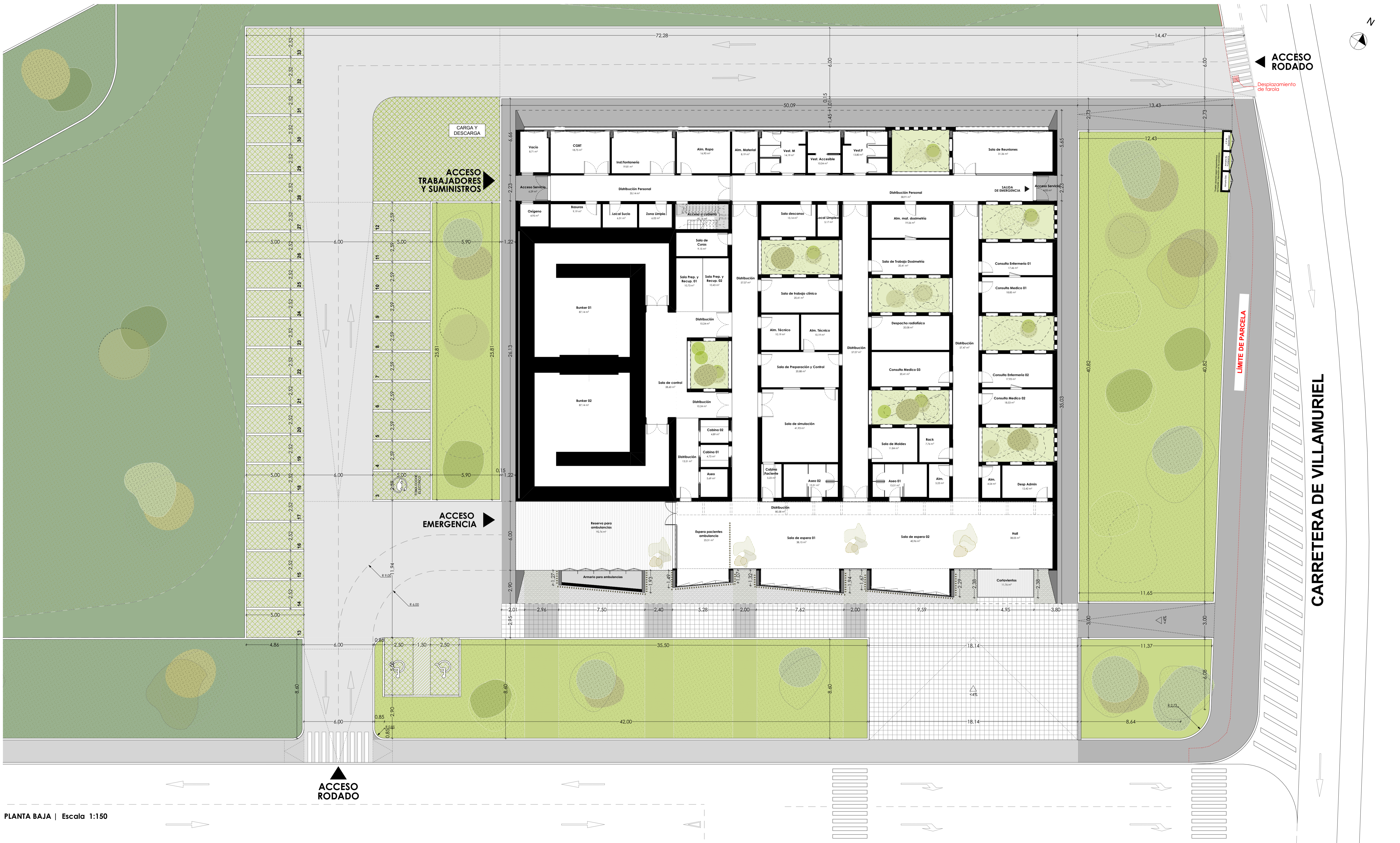
PLANTA BAJA | Escala 1:150