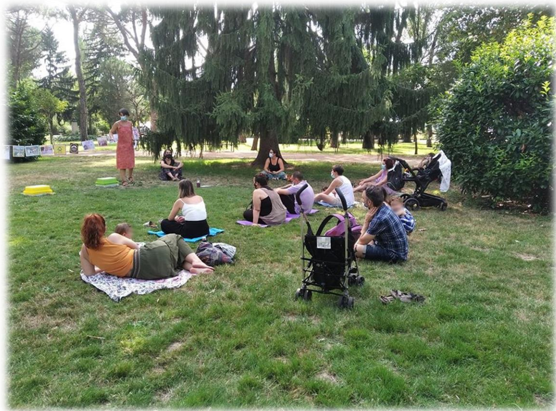
Uno de los encuentros al aire libre de madres/padres en la nueva realidad, para mantener la distancia social según la normativa de la comunidad.

El resto de los sectores han seguido las normas de desescalada dadas a la población general desde el Ministerio de Sanidad, siguiendo las fases 1, 2, 3, y de la “ nueva normalidad ” en la que nos encontramos al término de este informe y sin la certeza en la evolución en un futuro próximo.