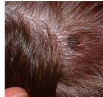
Escara necrótica