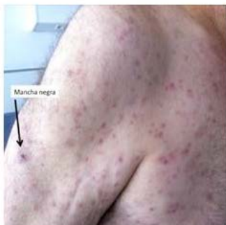
Escara y exantema de la Fiebre botonosa