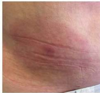
Eritema crónico migrans (Lyme)