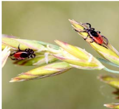
Figura 2: Garrapatas y enfermedades más frecuentes relacionadas con la picadura.