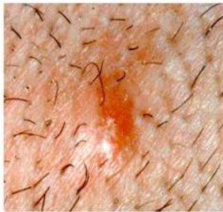
Pápula pruriginosa tras picadura garrapata