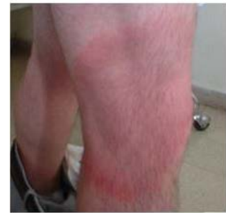
Eritema crónico migrans (Lyme)