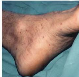
Exantema planta pie típico Fiebre botonosa