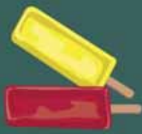
helados de agua