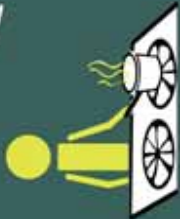
cocinar los alimentos