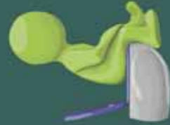
diarrea acuosa (en casos graves con sangre y mucosidad)