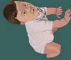
la enfermedad es más severa en niños pequeños