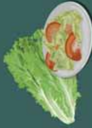
vegetales o ensaladas