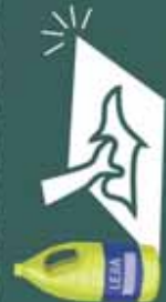
limpiar superficies de elaboración