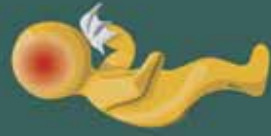
fiebre dolor abdominal