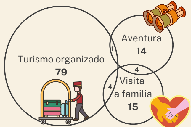
Diagrama de Venn de principales motivos de viaje con nº de viajeros por motivo

*Datos referentes a los viajeros atendidos en los CVI de Castilla y León, obtenidos de VIVA