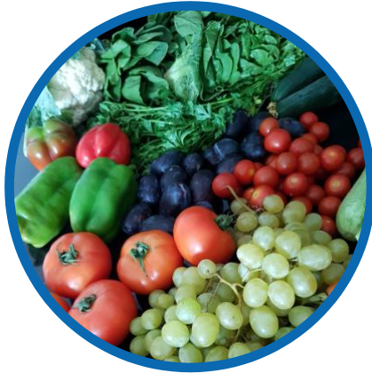
Comer fruta y verdura