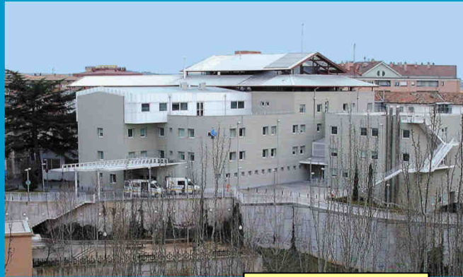
Hospital Santos Reyes

Servicio de Prevención de Riesgos Laborales Área de Salud de Burgos Telf. 947 257470