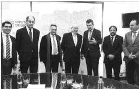
El pleno del Consejo de Cuentas durante la reunión en León.

En relación a los ingresos corrientes liquidados, en 2014 el endeudamiento financiero se posicionó en el 52,8 por ciento de media, con valores inferiores al 75 por ciento en todas las instituciones provinciales.