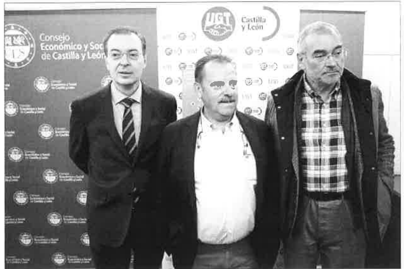
Los ponentes en la inauguración de la jornada organizada por UGT en la sede del Consejo Económico y Social.

Una mujer de 21 años fue detenida al tratar de introducir cinco bellotas de hachís ocultas en su ropa en el Centro Penitenciario de Segovia. El dispositivo contó con el apoyo de un agente y de un perro especialista en detectar estupefacientes.