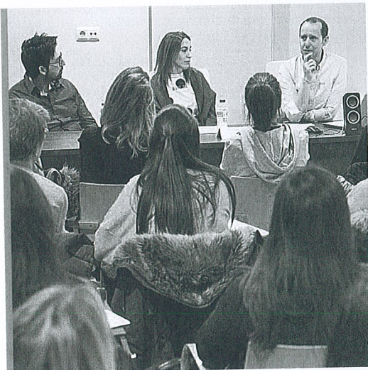
Mesa redonda celebrada ayer.

Los hospitales mejor situados son, por este orden, La Paz, el Clinic de Barcelona y el Gregorio Marañón. El Complejo Asistencial Universitario de Salamanca es el que mejor posición ocupa del ranking de la comunidad, puesto número 20. Le siguen el Río Hortega y el Clínico de Valladolid en los puestos 26 y 33, y el hospital de León en el 56.