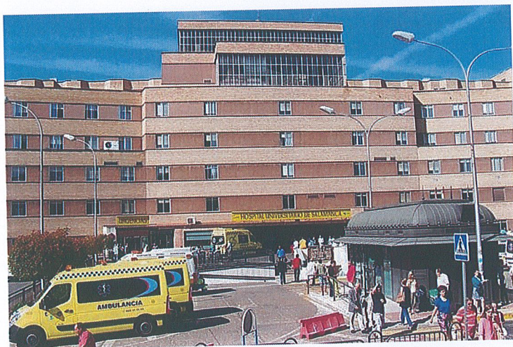
La fachada del hospital Clínico.

El Complejo Asistencial Universitario de Salamanca es el que mejor reputación tiene en Castilla y León, al situarse en el puesto número 20 del Monitor de Reputación Sanitaria (MRS), que analiza a los 100 hospitales públicos españoles con mejor valoración. Además, otros cinco de la Comunidad figuran en este estudio, aunque en peores posiciones, y tres de ellos han empeorado en el último año su nota. Dónde estaríamos si no tuviéramos las listas de espera más escandalosas de la región.