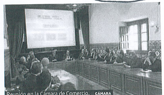
Reunión en la Cámara de Comercio. CÁMARA

La Asociación de Examinadores de Tráfico ha convocado del 10 al 21 de diciembre una nueva huelga.