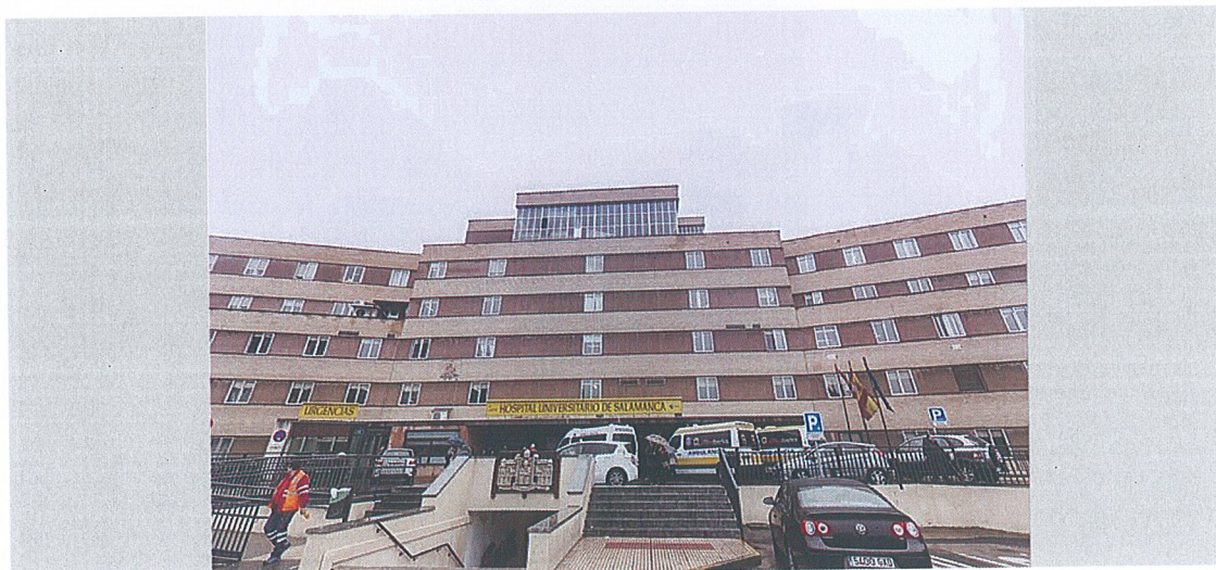
Hospital Universitario de Salamanca.

El Complejo Asistencial Universitario de Salamanca figura en el puesto 20; el Río Hortega en el 26; el Clínico, en el 33, el de León, en el 56; el de Zamora, en el 58 y el de Burgos, en el 83