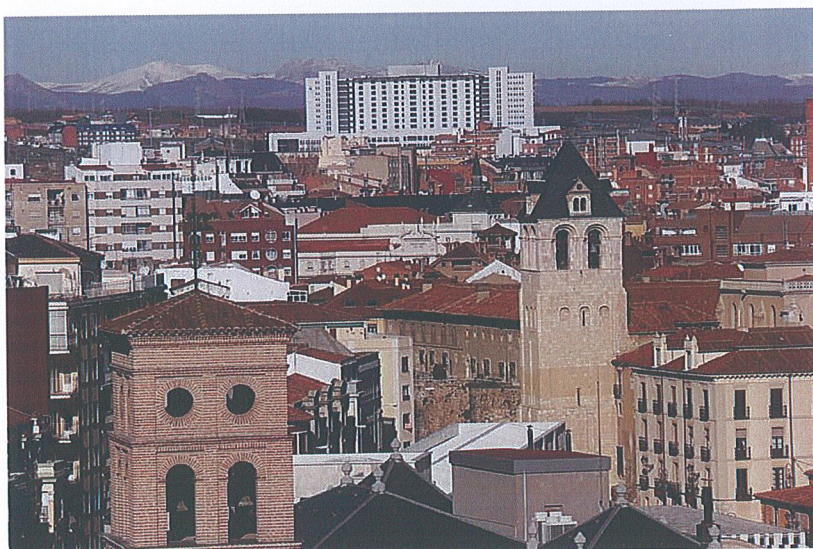
Vista del Hospital de León desde la ciudad.

El Hospital de Salamanca es el que tiene mayor reputación de la Comunidad y logra el puesto 20 entre 100 españoles