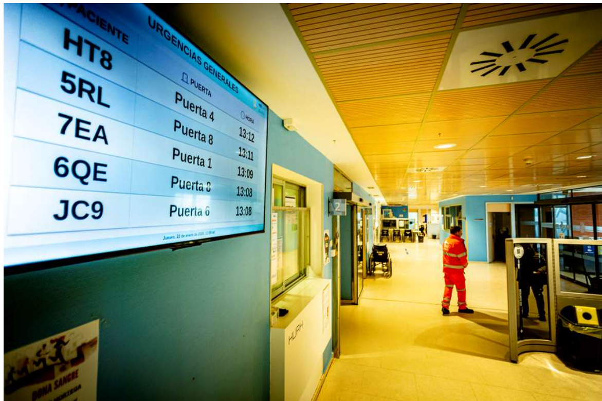
Pantalla instalada en el Servicio de Urgencias.

El hospital implanta en Quirófanos, Urgencias y la cafetería un sistema de pantallas con códigos alfanuméricos para cumplir con la normativa de protección de datos personales