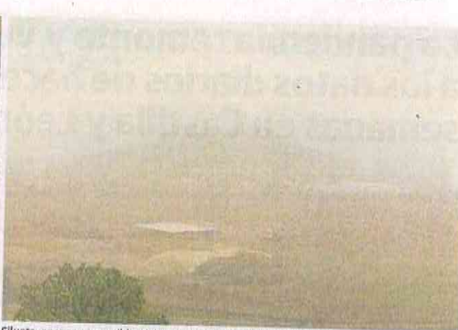
Silueta, apenas perceptible, del cerro de San Cristóbal. A. MINGUEZA