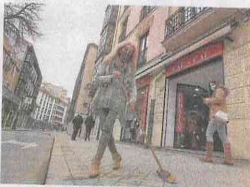
Una comerciante barre el polvo de la acera frente a su tienda. c. ESPESO

En relación con la limpieza de la ciudad, Alberto Palomino, concejal de Salud Pública y Seguridad, explica que, en principio, los encargados del mantenimiento de las calles tienen claro que no se puede emplear agua para lim-