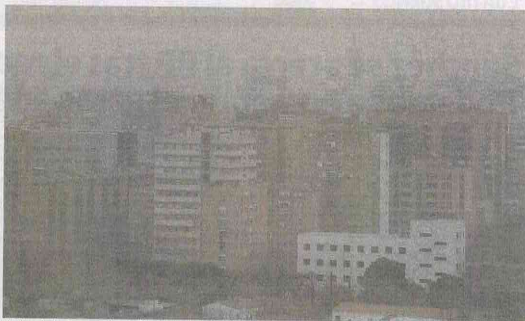
El polvo sahariano en suspensión cubrió la capital vallisoletana de una tonalidad anaranjada y dejó un horizonte sumido en la neblina. CARLOS ESPESO

Otro problema de este polvo es que «vehiculiza pólenes y virus, algo que es realmente malo para gente con patologías respiratorias». Por ello, recomienda que se mantengan las ventanas ce-