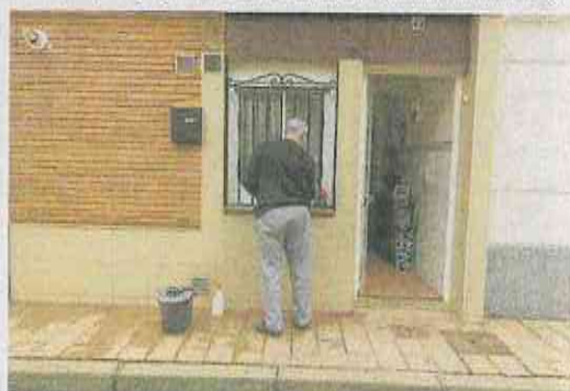
El turbio aire africano depositó sus partículas en edificios y suelo. A. M.

rradas durante estos días y que se evite realizar actividades al aire libre, así como deporte. La mascarilla, explica, es «muy útil en la calle para prevenir afecciones respiratorias más severas».