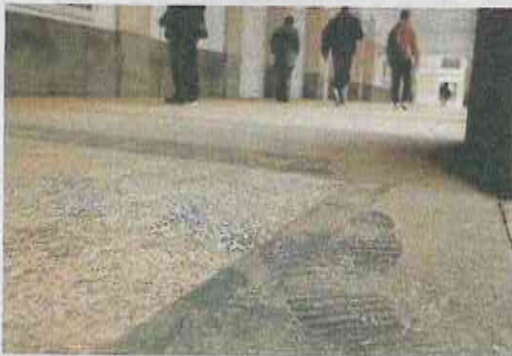
Huellas sobre la arenilla en los soportales del Teatro Calderón. c. n.