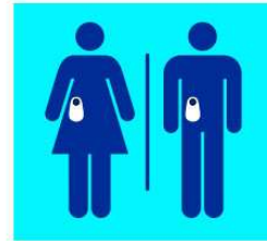
Ubicación de los servicios para personas ostomizadas en los hospitales de Castilla y León