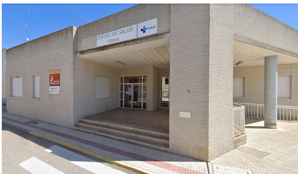
Centro de salud de Villoria.

Sanidad reorienta la fidelización de residentes que terminan su formación hacia al medio rural y los hospitales más pequeños