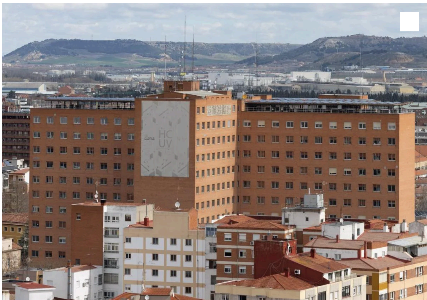
El Hospital Clínico de Valladolid. A. Mingueza

Sanidad convoca un total de 539 plazas para fidelizar a los residentes que finalizan su formación en hospitales y atención primaria