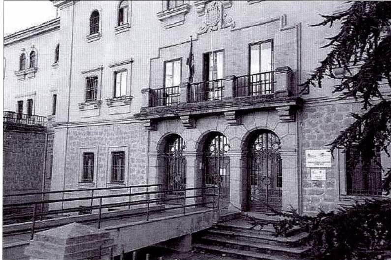
Residencia Fuente Clara, ubicada en la capital abulense.

El miércoles la Guardia Civil de Ávila informaba de que estos jóvenes habían sido expulsados de un tren en esa localidad madrileña por viajar sin billete y molestando al resto del pasaje. Tras ser informados por un trabajador de ADIF desde la Benemérita se puso en marcha un dispositivo para localizarlos que dio sus frutos ya que les encontraron junto a la vía férrea en el kilómetro 80,5; esto ocurría el día 29, la misma jornada en la que tras ser localizados se puso en