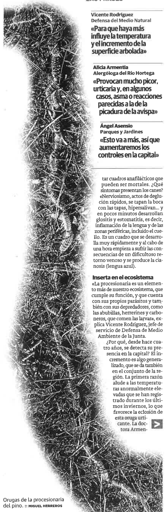
Orugas de la procesionaria del pino.