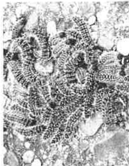
Procesionaria en Parquesol.

Esta es la labor preventiva que ha adoptado, de momento, el Servicio