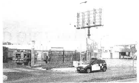
Bomberos y Policía, durante la extinción del incendio.

Frente a estas medidas de control, la recomendación de los expertos es evitar acercarse a la procesionaria y salir a pasear con niños y mascotas por zonas donde no sea habitual su presencia, lejos de pinares (además de en los pinos, ahora se empiezan a detectar también en abetos y cedros). Algunas ideas de paseo cerca de esos barrios afectados son el cerro de Las Contiendas o el Canal de Castilla, donde apenas están presentes.