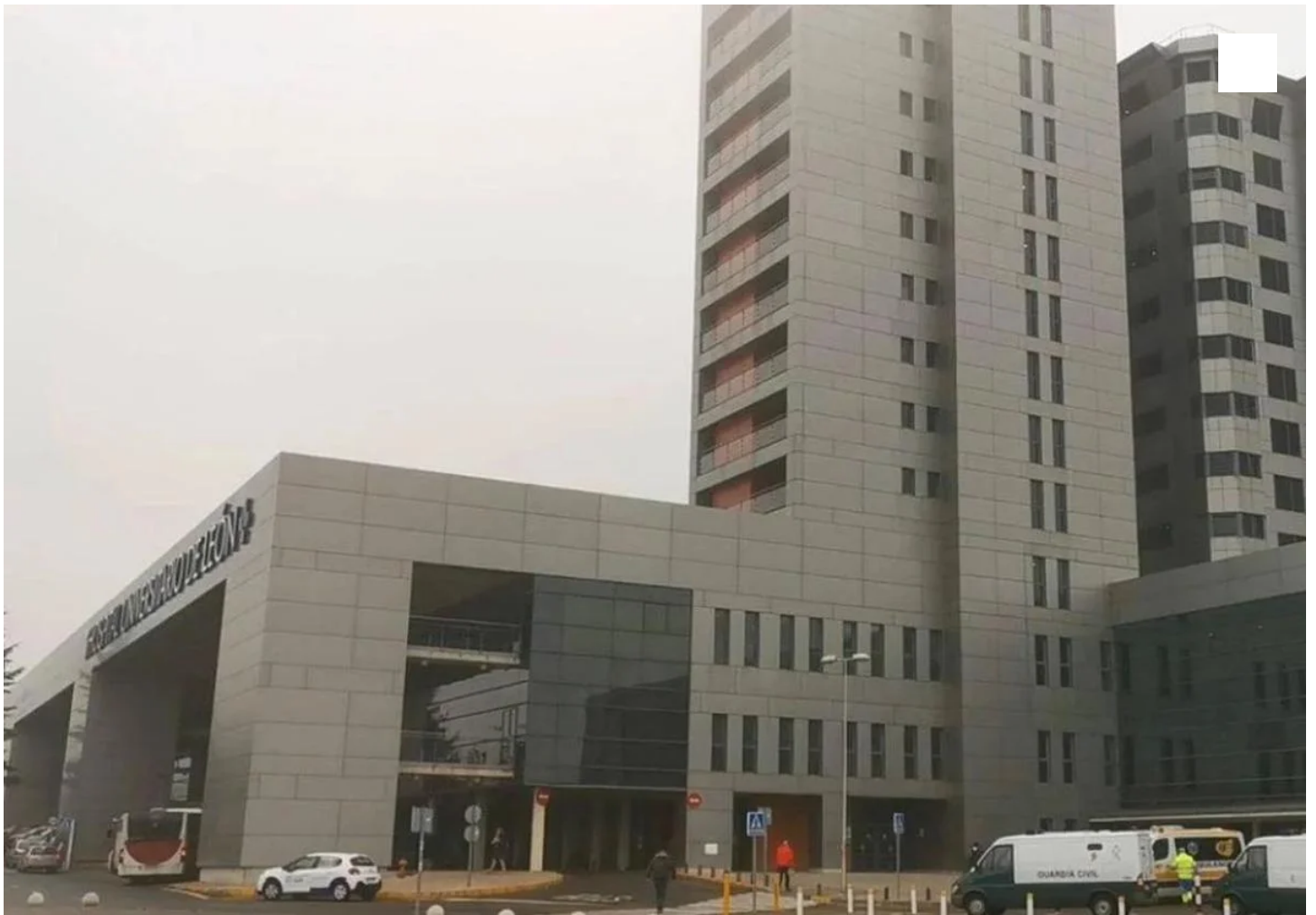
Hospital de León.

Aves, caza y huevos son los mayores incrementos en los costes del centro asistencial leonés