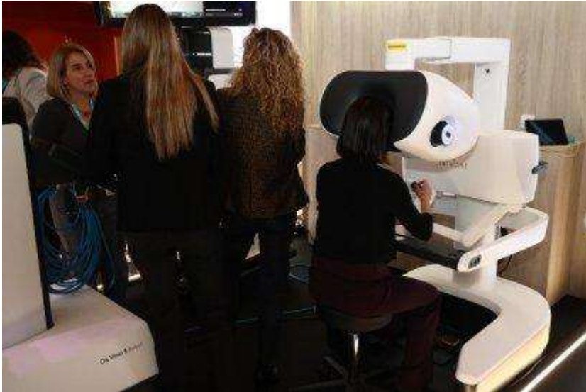
Robot quirúrgico Da VinciPHOTOGENIC