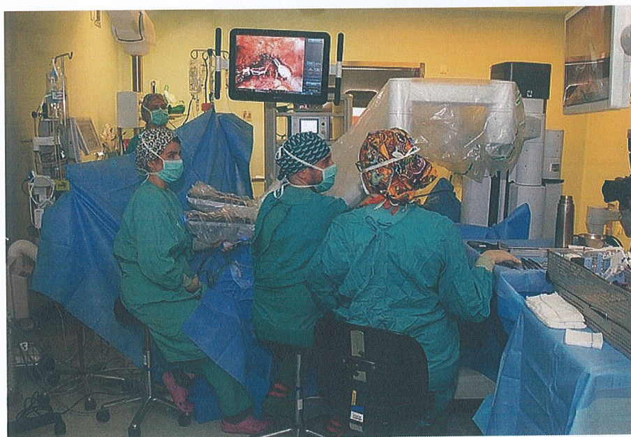
Operación con cirugía robótica en el Río Hortega.

La zona del Hospital Río Hortega pasa a colocarse entre el pequeño grupo de organizaciones sanitarias que son consideradas excelentes, tanto por su trabajo actual como por la posibilidad que tienen de seguir mejorando