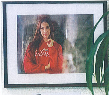
Una de las obras de 'Miradas de Mujeres Gitanas'.