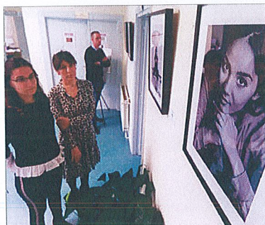
Detalle de una de las fotografías expuestas.

El acto sirvió para recordar que existen «Mil motivos para conocer a las mujeres gitanas, mil motivos para defender los derechos de todas las mujeres».