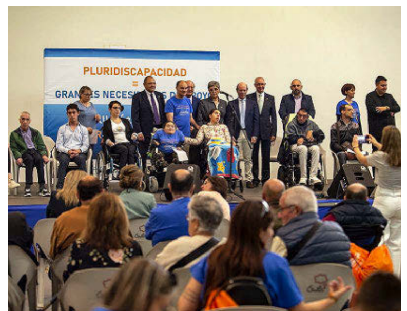
Celebración del Día Regional de la Parálisis Cerebral en Ávila.

colectivo» y se refirió a la proposición no de ley que el Partido Popular tiene previsto presentar este mismo miércoles en las Cortes y en la que «se instará al Gobierno a incluir aspectos de la cartera de salud bucodental en la cartera básica de servicios del Sistema Nacional de Salud», como, por ejemplo, la asistencia bucodental con sedación empleando el quirófano para las personas con discapacidad. La celebración contó con la presencia de más de 300 personas llegadas de todos los puntos de Castilla y León.