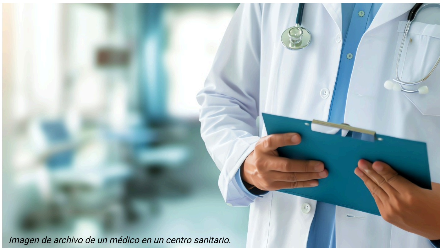
Imagen de archivo de un médico en un centro sanitario.