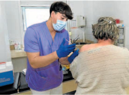
Vacunación de la gripe en el inicio de la campaña en octubre. BRÁGIMO