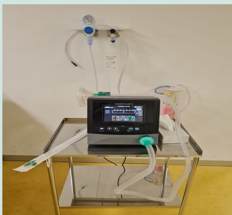
FORTALECIMIENTO DE LA MUSCULATURA RESPIRATORIA