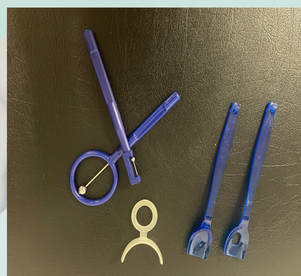
CONTROL Y MANEJO DE LA DEGLUCIÓN