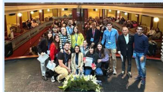
Imagen del III Congreso Nacional de Enfermería