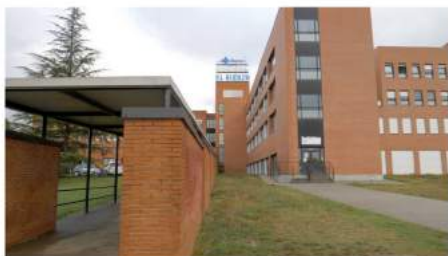
Hospital del Bierzo.

El próximo viernes, 28 de octubre, se celebrará en el Hospital El Bierzo la XII Jornada de Cuidados de Enfermería Gacela Care de Castilla y León