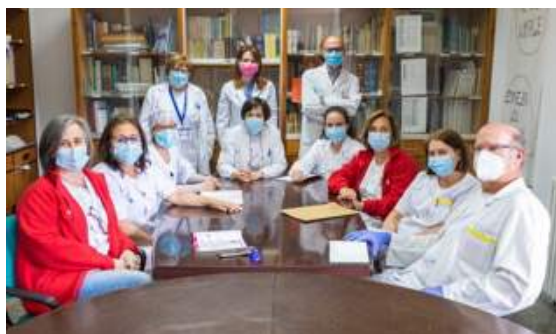
C.S. Ponferrada II