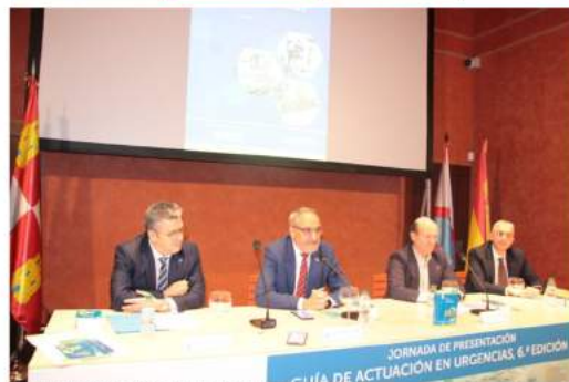
Presentación de la sexta edición de la Guía de Actuación en Urgencias.