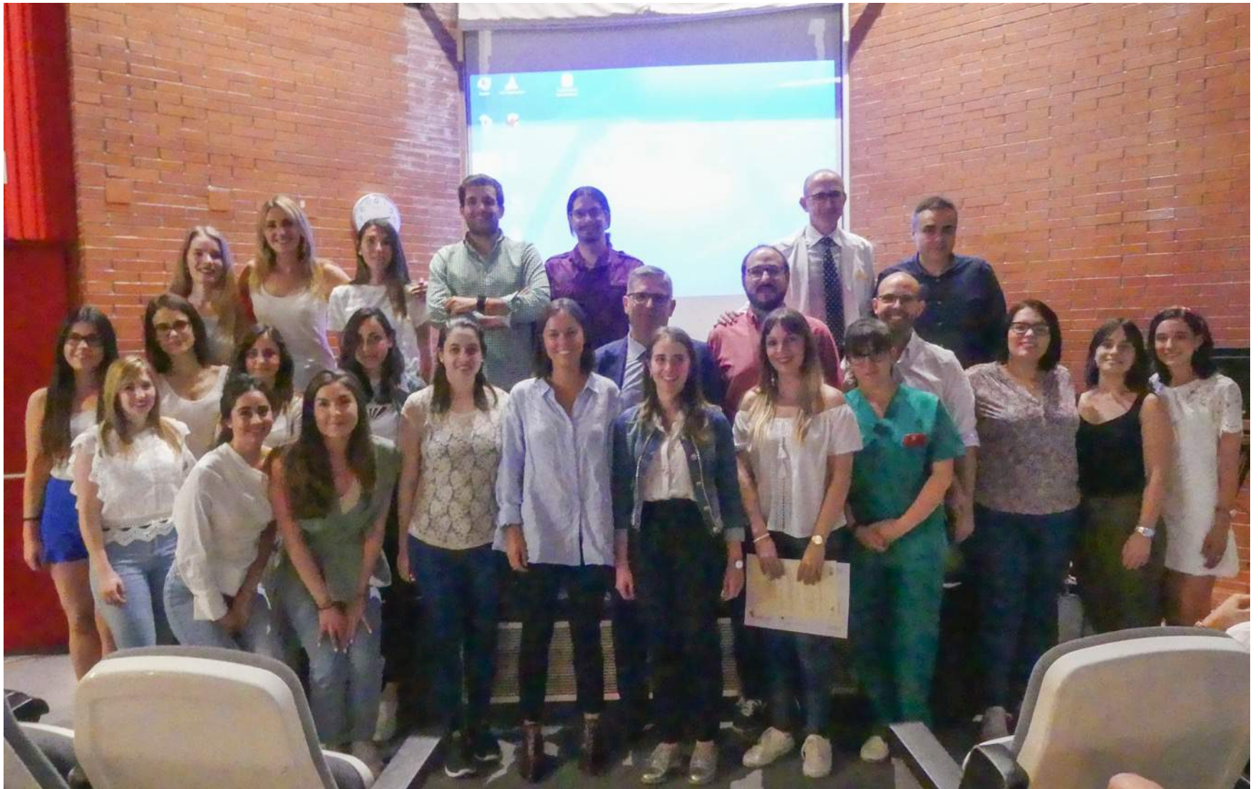
Bienvenida Residentes GASBI 2018