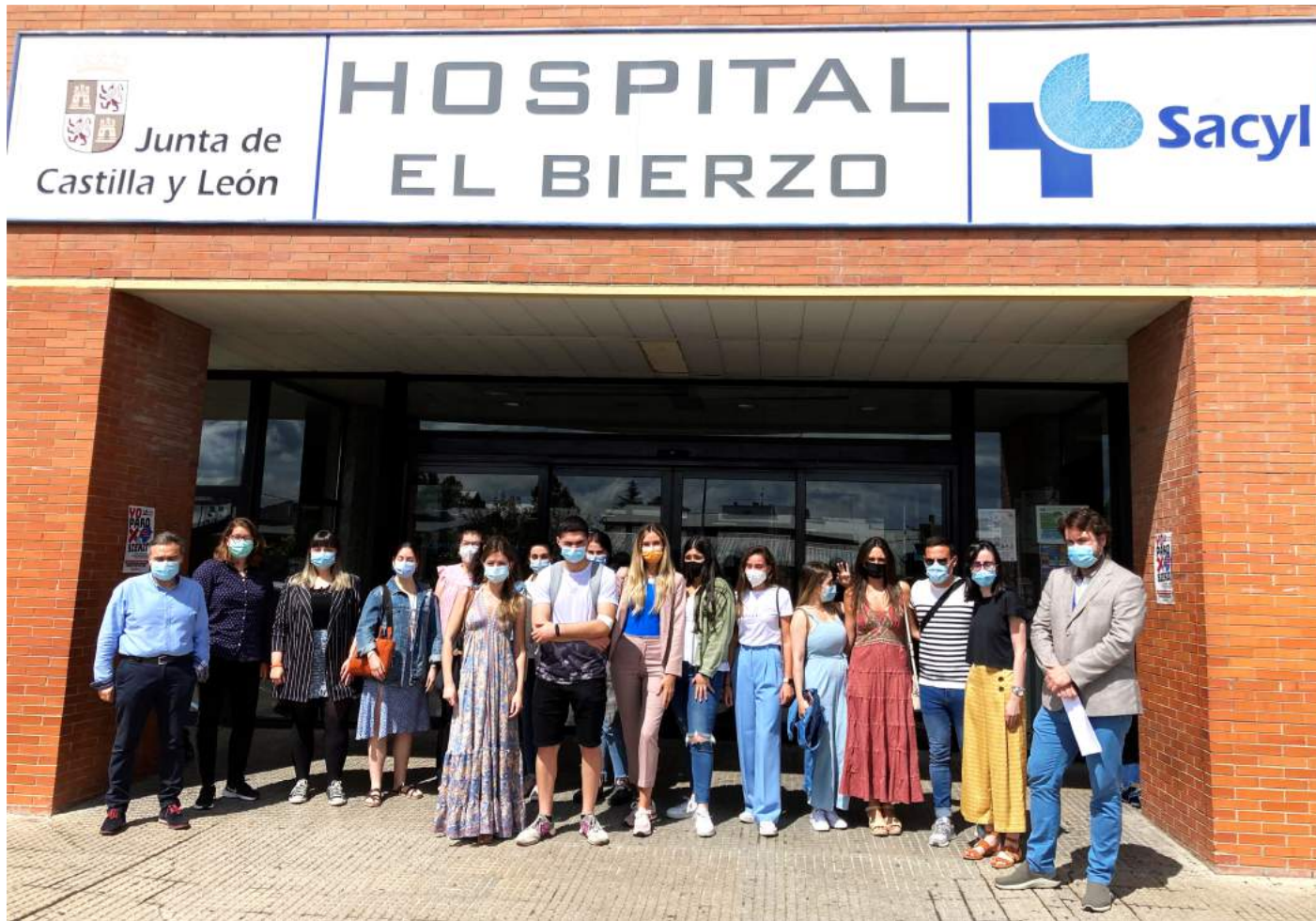
Bienvenida Residentes GASBI 2022