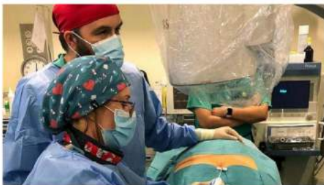
Novedosa técnica de tratamiento del dolor de espalda en el Hospital El Bierzo.

Agencia ICAL 13 de diciembre de 2022-16:18h Actualizado el 13/12/2022-16:21h