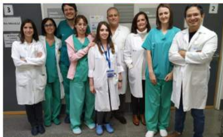
El equipo de oftalmólogos y residentes de esta especialidad del Hospital El Bierzo.