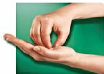
6.-Puntas de los dedos