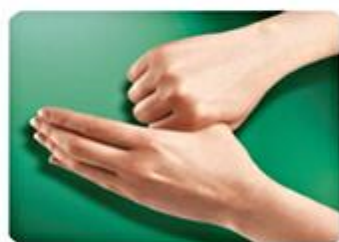
5.-Rotación del pulgar