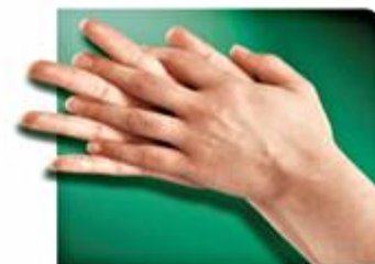
3.-Palmas dedos entrelazados