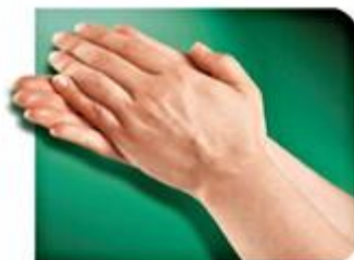
1.-Palma contra palma