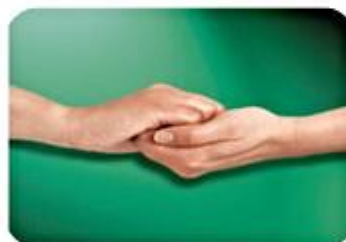
4.-Dorso contra palma