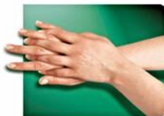
2.-Palma contra dorso