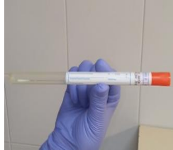
Hisopo Dacron varilla metálica y flexible (tapón naranja)