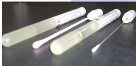
hisopo (con medio de transporte)