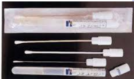
hisopo (sin medio de transporte)