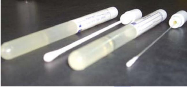
Hisopo con medio de transporte