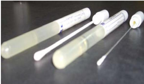
hisopo (con medio de transporte)