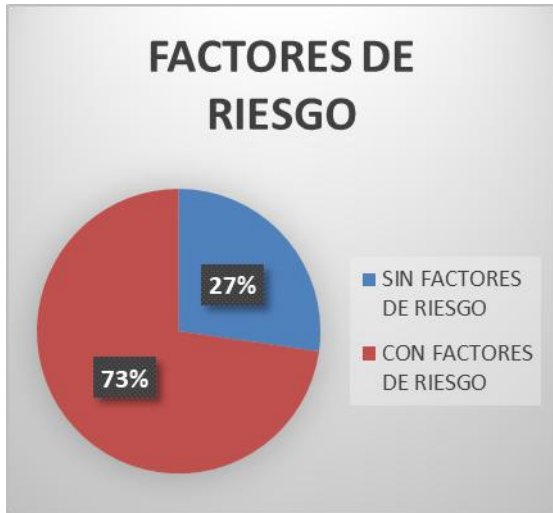
Figura 1. Diagrama de sectores que diferencia entre pacientes portadores y no portadores de factores de riesgo.